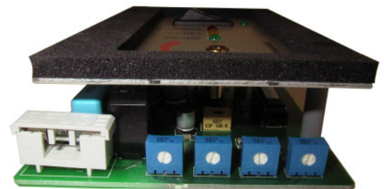
Styrkort PX mod 2