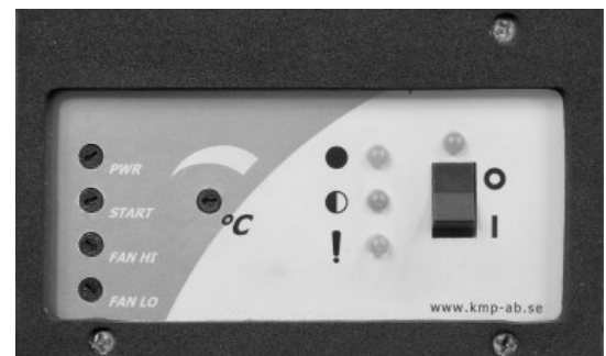
Styrkort PX mod 3